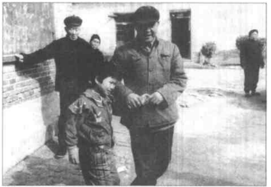
出院后，丽丽又回到盐窝镇敬老院，回到疼爱她的老人及护理人员身边。

这次手术支出医药费、手术费、住院费、护理费、生活费等共计22000多元，其中院方减免、承担了5400多元，剩余16500元由市、县两级残联共同承担。